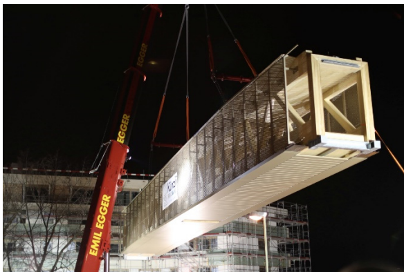
Bau- und Montagephasen